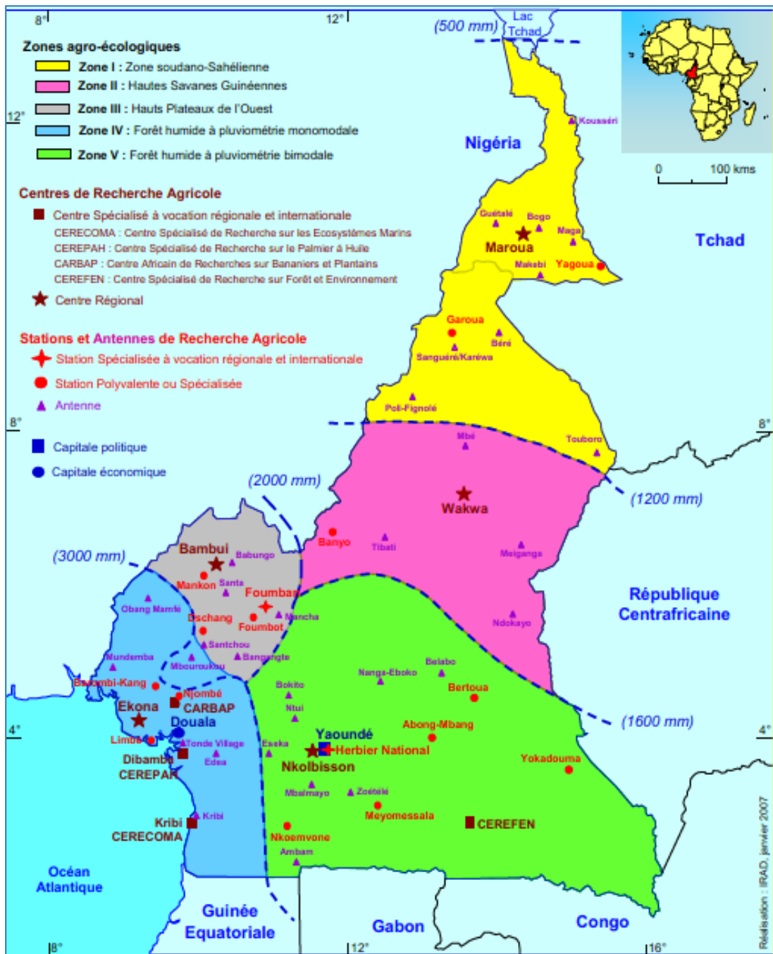
Figure 1:Zones agro-écologiques du Cameroun